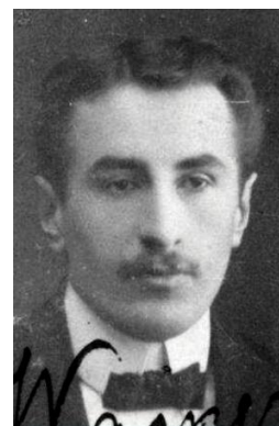
б) 1930-е гг.