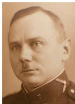
б) 1930-е гг.