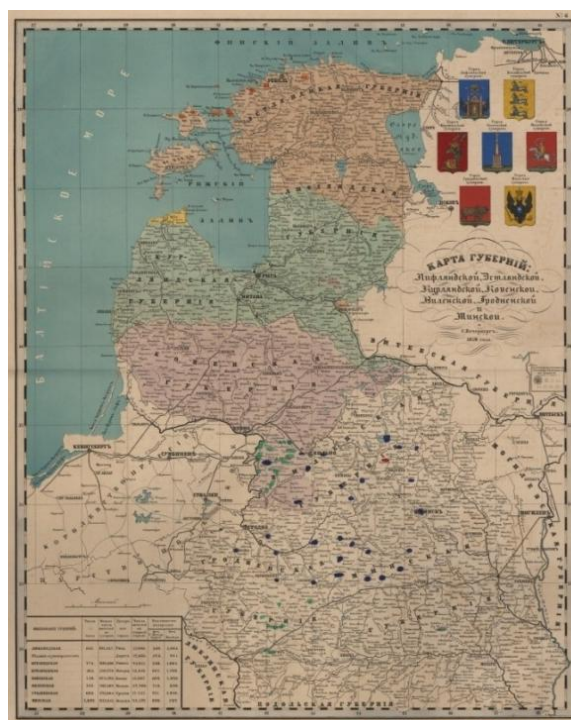
Источник: Административно-территориальное деление Российской империи. URL: https://www.rusempire.ru/rossijskaya-imperiya/administrativno-territorialnoe-delenie-rossijskoj-imperii.html (дата обращения: 18.11.2024). Source: Administrative-territorial division of the Russian Empire. URL: https://www.rusempire.ru/rossijskaya-imperiya/administrativno-territorialnoe-delenie-rossijskoj-imperii.html (accessed: 18.11.2024).

В конце XIX – начале XX века Остзейские губернии располагались на площади свыше 94 тыс. кв. км, представляя из себя преимущественно аграрные регионы, занятые животноводством, земледелием и рыболовством.