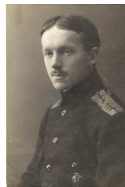
б) 1916–1917 гг.