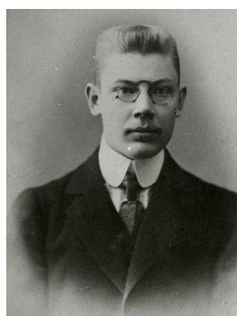
г) 1922 г.