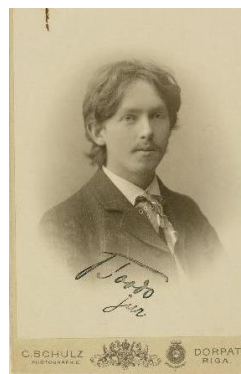
а) 1910-е гг.