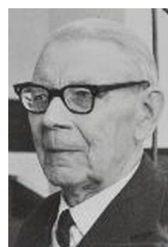
е) 1974 г.