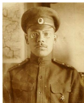
б) 1916–1917 гг.