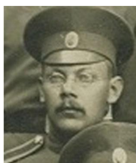
а) 1916 г. [1]