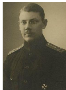
в) 1917 г.