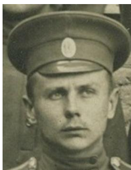
а) май 1916 г.