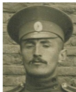
а) май 1916 г. [1]

карьеру в качестве архитектора. В ПВУ поступил 01.02.1916 г., был зачислен юнкером рядового звания в 5-ю роту. Данных о его распределении после выпуска нет. Но при этом он сохранил большой архив фотографий о своей службе в 131-м пехотном Тираспольском полку РИА в годы ПМВ. Удивительно, что, несмотря на его офицерский чин в РИА, участие войне за независимость на стороне эстонских формирований, неоднократные поездки за границу и проживание в годы Великой Отечественной войны на оккупированной территории, в СССР он не подвергался репрессиям 18 . За свою жизнь был