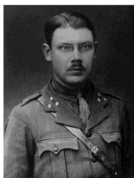
д) 1930-е гг.