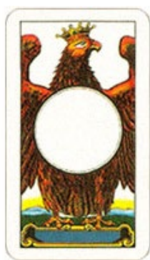
Karte mit Freikreis für Steuerstempel

Другой предмет государственной монополии в германских государствах – соль – был не столь эксклюзивным товаром; напротив, соль находилась в широком употреблении.